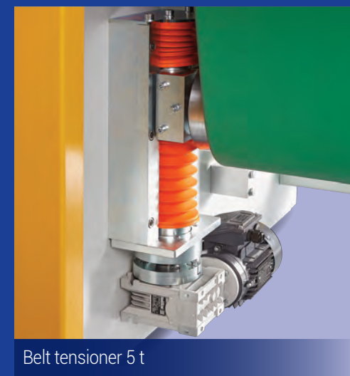
Belt tensioner 5 t